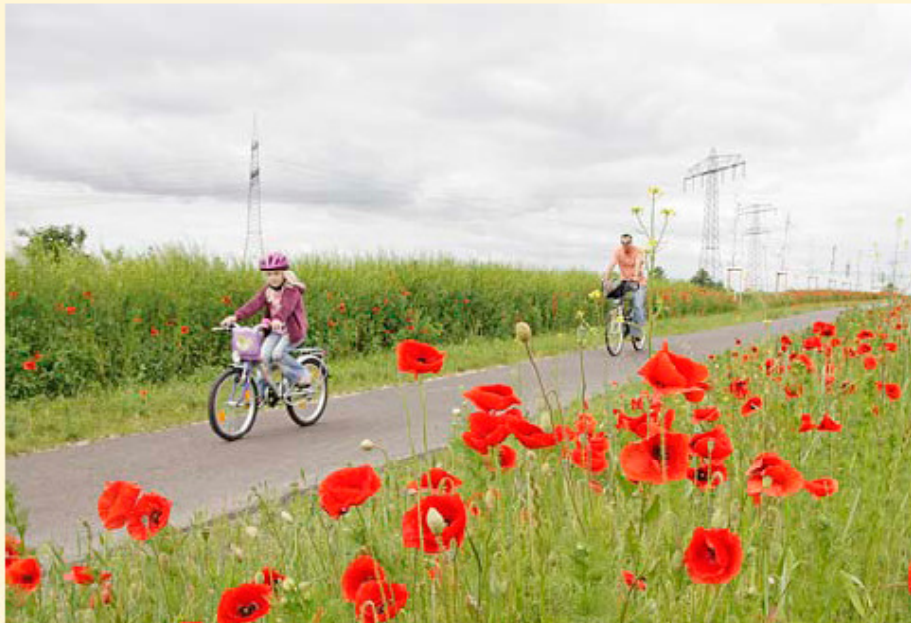
Das Holunderradwegenetz führt über gut ausgebaute und auch für Kinder sichere Radwege.

Alle Routen sind mit dem violetten Holunderpiktogramm auf leuchtend grünen Wegweisern gekennzeichnet.